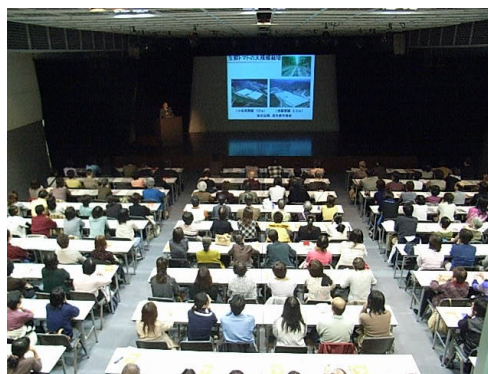
健康セミナー 2008年11月9日(日) A&Hホール