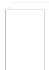
クリエイティブ案※3種 ※サムネイル（ラフ）