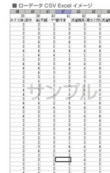
アンケートローデータ