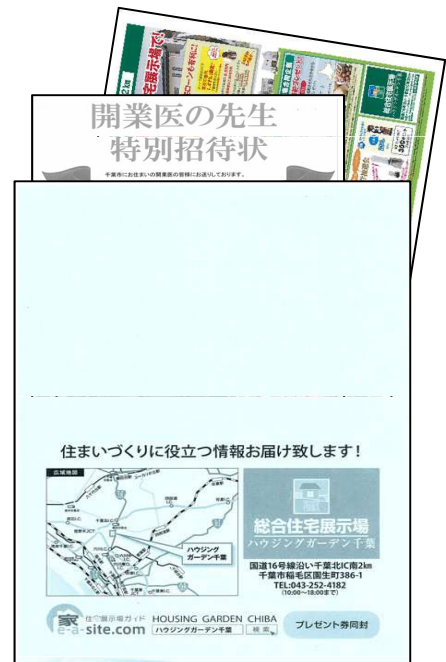
※ハウジングギャラリー千葉様