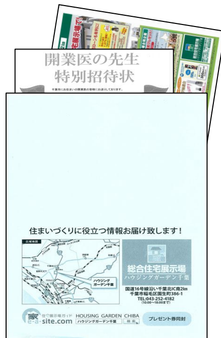
※ハウジングギャラリー千葉様