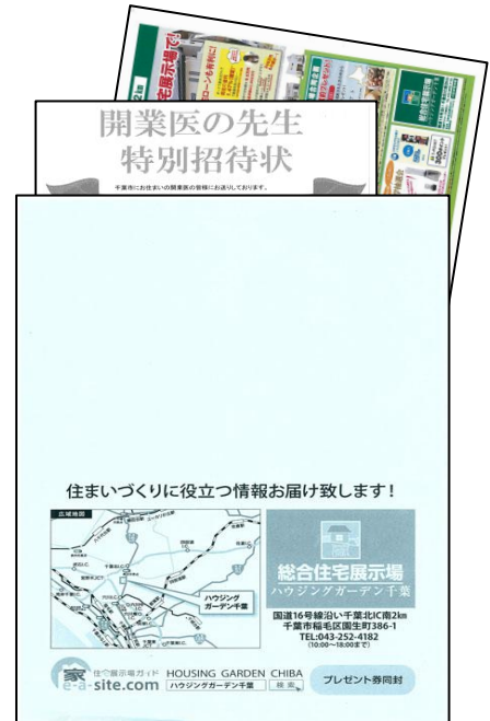
※ハウジングギャラリー千葉様